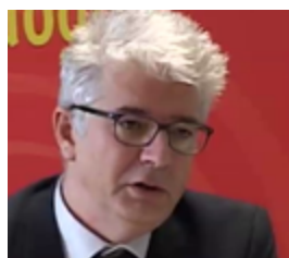
Pierre Lacueille , Délégué académique à la formation des personnels de l'Éducation nationale (DAFPEN) - France